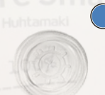
D95872 Крышка плоская с отверстием

Прозрачная, PLA Ø 95 мм 50 шт./упак. 30 упак./кор. 20 кор./паллет 1500 шт./кор. 30000 шт./паллет