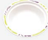
00905 Тарелка суповая Chinet

Flavour Формованное волокно 260x190 мм 50 шт./упак. 7 упак./кор. 350 шт./кор. 30 кор./паллет 10500 шт./паллет