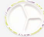
00903 Тарелка 3-х секционная Chinet

Flavour Формованное волокно 400 мл, Ø 180 мм 50 шт./упак. 10 упак./кор. 500 шт./кор. 36 кор./паллет 18000 шт./паллет