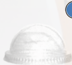
D95871 Крышка купольная с отверстием

Полностью компостируемый в промышленных условиях