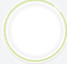
00922 Тарелка Chinet

Good to Go Формованное волокно Ø 170 мм 50 шт./упак. 12 упак./кор. 600 шт./кор. 36 кор./паллет 21600 шт./паллет